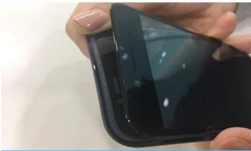
5. 후면 보호판 제거 *보호판 제거 시 필름 휘어지지 않도록 주의