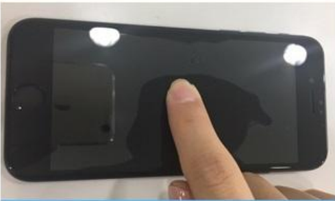
7. 액정 가운데 부분을 눌러 자연스럽게 부착