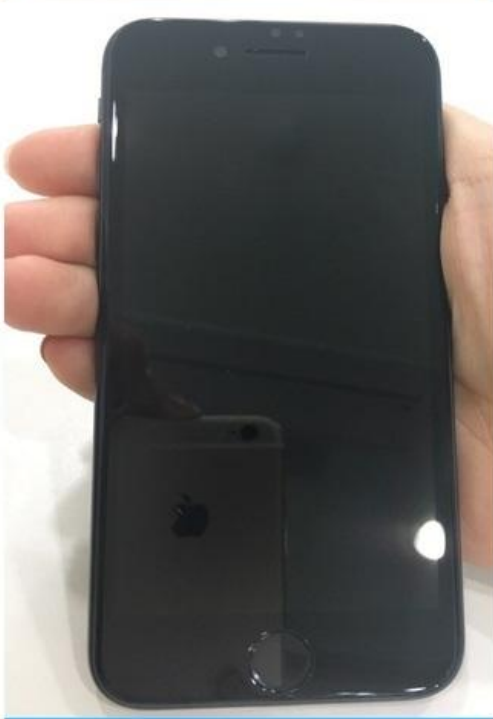
8. 부착 완료