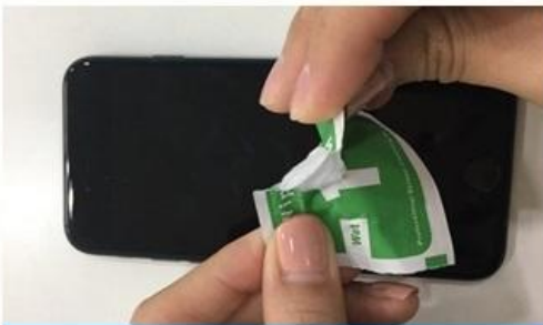
1. 1번에 동봉된 알콜솜 개봉