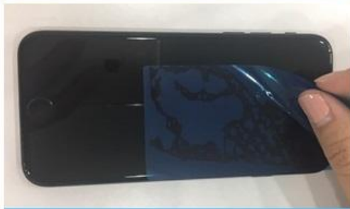
4. 동봉된 파란 스티커 먼지 제거로 마무리