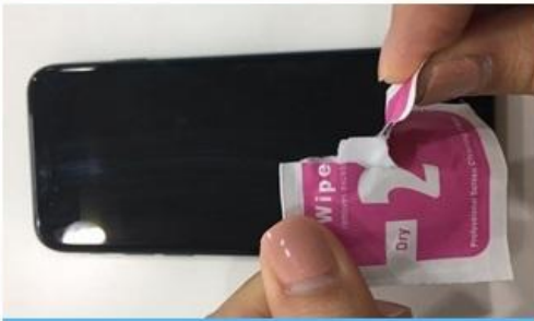
3. 2번에 동봉된 마른솜으로 알콜솜 물기 제거